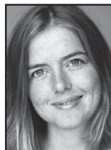
Ellen Trane Nørby (V)