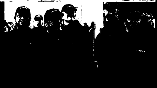
Den svenske vinder vandt med en laks på næsten 15 kg

Tilbagemeldingerne fra deltagerne og ikke mindst analysen af TV-udsendelserne, som viste, at det var muligt at skabe spændende, engageret og billedrigt TV ud af en lystfiskerkonkurrence, har betydet, at det allerede kort efter begivenheden blev besluttet at gentage konkurrencen i 2006.