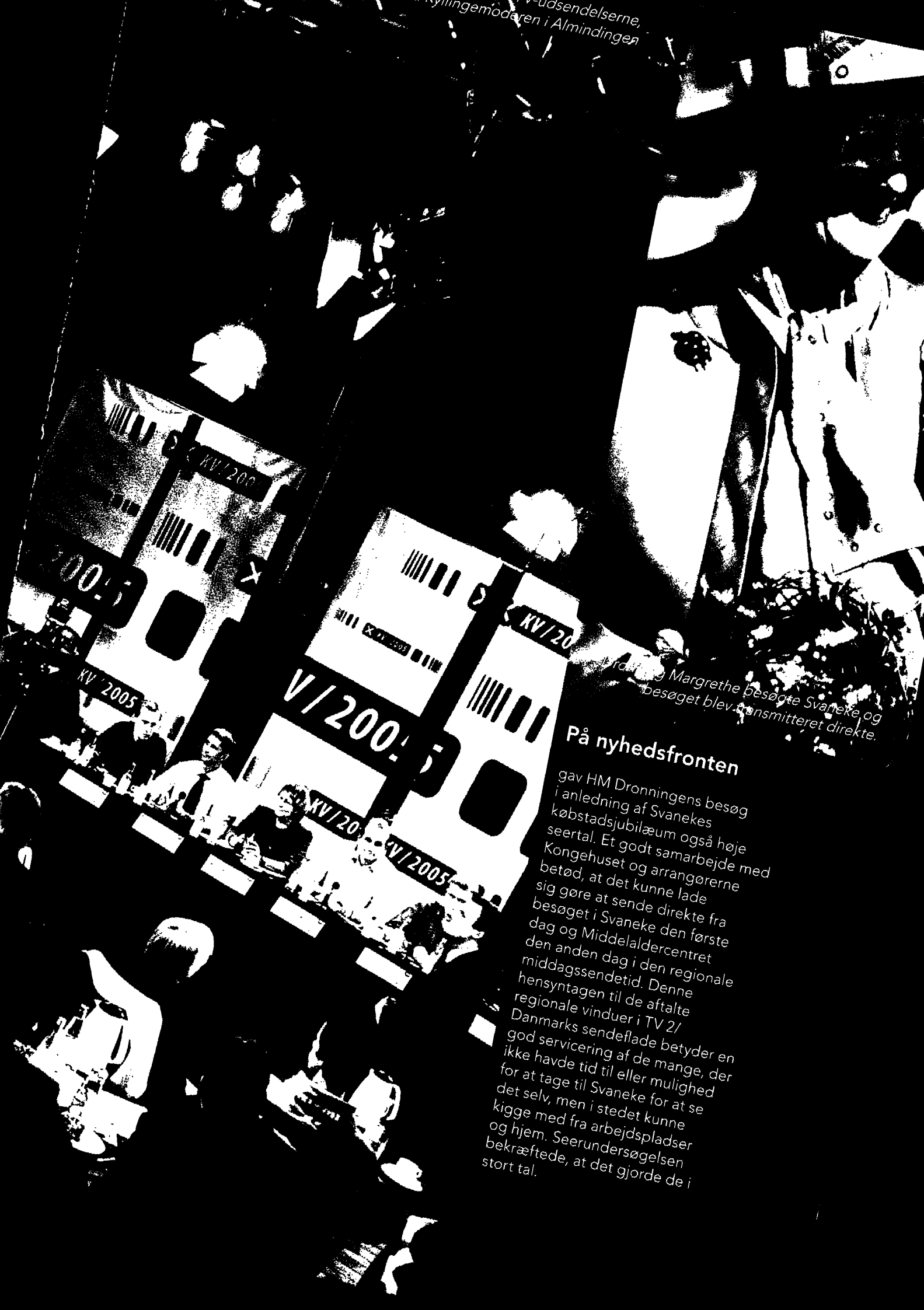
Prins og Margrethe besøgte Svaneke, og besøget blev transmitteret direkte.

...udsendelserne, ... ...Kyllingemødaren i Almindingen