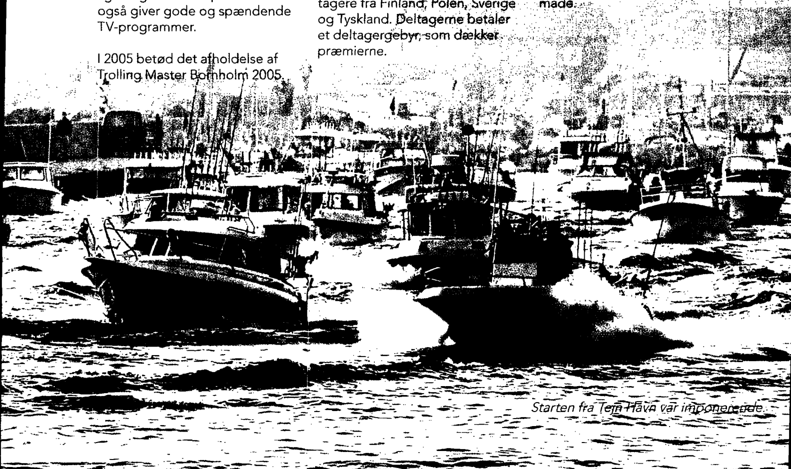
Starten fra Tejn Havn var imponerende.

Ved årets udgang var der flere tilmeldinger til Trolling Master Bornholm 2006 end til den første konkurrence, og tilmeldingen er stadig åben. Det kan betyde, at det kan gå hen og blive Skandinaviens største trollingkonkurrence, og dermed sætte Bornholm på landkortet på en ny måde.