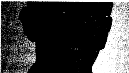
Jens Hald Madsen, erhvervspolitisk ordfører (V)