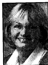
Pia Kjærsgaard (DF)