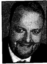
Lars Christian Lilleholt (V)