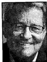
Niels Helveg Petersen (RV)