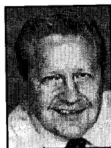
Svend Erik Hovmand (V)