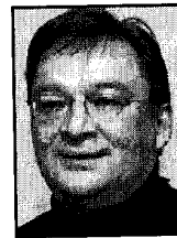
Kuupik Kleist (IA) Formand