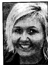
Carina Christensen (KF)