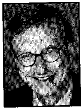
Kim Andersen (V)