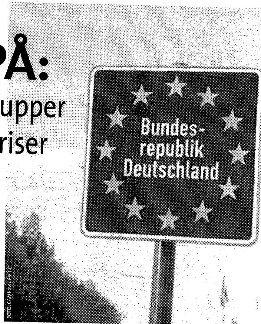
På den anden side af grænsen scores kassen på afgiftsplagede danskere. Ud over øl og marcipan køber vi også campingvogne, både, brugte Mercedes- og BMW-biler, vaske-maskiner og vin.

Man profiterer med andre ord på, at danskerne er vilde med grænsehandel og tror sig sikre på at have sparet meget mere end tilfældet i virkeligheden er.