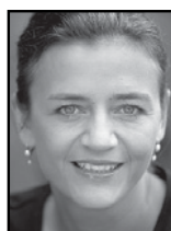
Margrethe Vestager (RV)