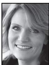
Helle Thorning- Schmidt (S)