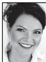
Inger Støjberg (V)