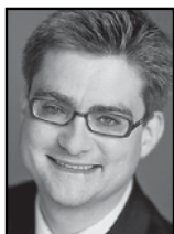
Søren Pind (V)