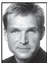
Kristian Thulesen Dahl (DF)