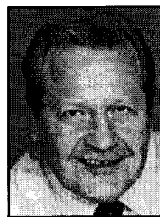
Svend Erik Hovmand (V)