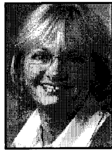
Pia Kjærsgaard (DF)