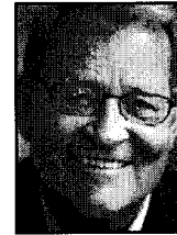
Niels Helveg Petersen (RV)