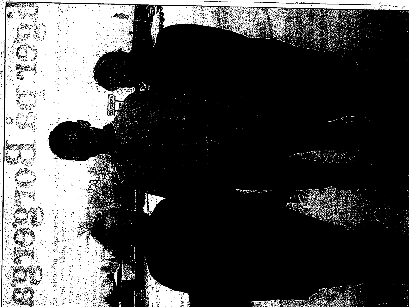
Omkrævet blokaderamt: det er et helt forkert skridt at tage en risikørfuld blokade og ødelægge en god lille