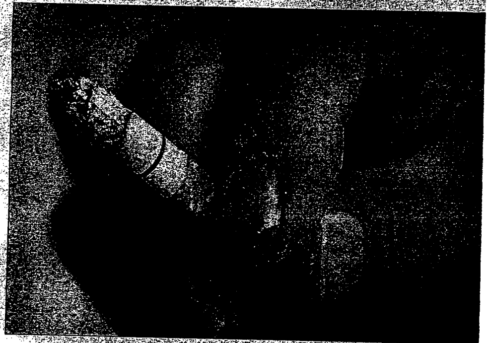
Cigaretter er livskvalitet for nogen, men en plage for andre. I Hjørring Kommune finder man en praktisk løsning på problemet ude på plejehjemmene.

Personalet selv ryger dog ikke i fællesrum, men har særlige rum at ryge i. Blandt de ældre har man diskuteret rygeregler, og man finder en praktisk løsning på tingene - rygerne må gerne ryge i fællesrummene, men det er fint