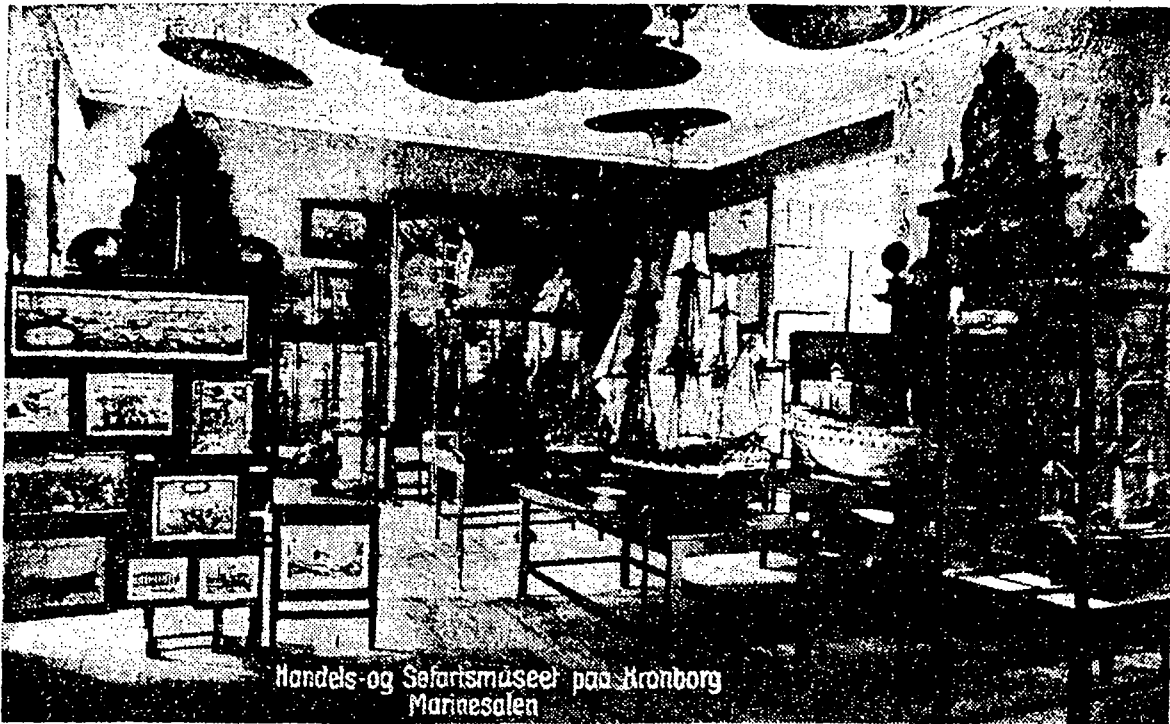
Handels- og Søfartsmuseum på Kronborg Mannesalen

Et af museets oprindelige lokaler på 1. sal med loftmalerier og en smuk kamin.