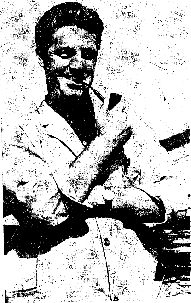
en glad mand