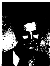
Inger Støjberg (V)