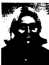
Carina Christensen (KF)