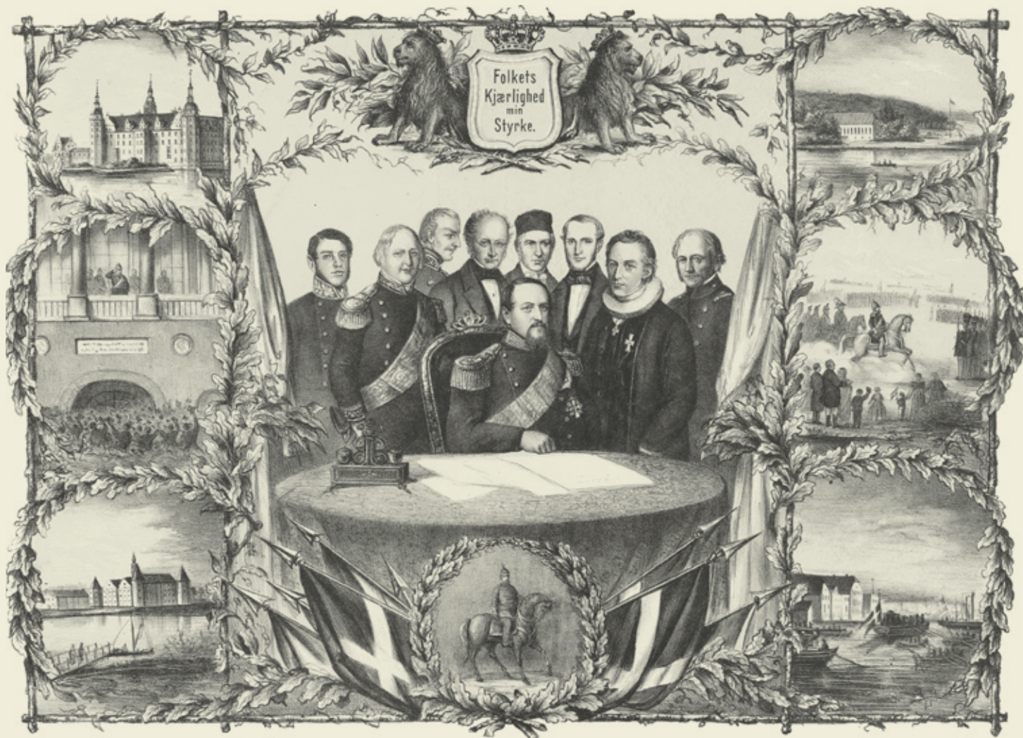
Frederik 7. underskriver grundloven. Litografi, Det Kongelige Bibliotek.