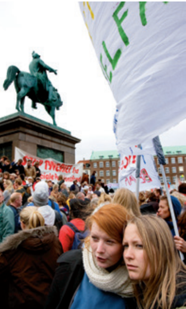
Grundloven giver os nogle rettigheder. Vi må f.eks. demonstrere for vores synspunkter.

Hvor meget magt har dronningen? Kan statsministeren indføre censur? Må politiet forbyde en demonstration? Har mænd værnepligt? Skal alle børn modtage undervisning? Det og meget mere svarer grundloven på.