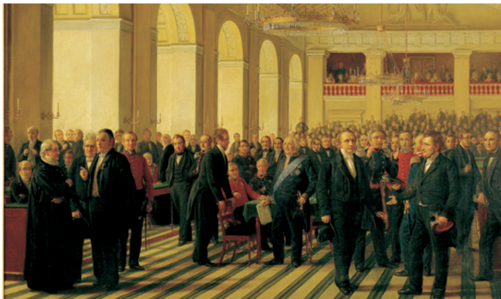
Den Grundlovgivende Rigsforsamling. Maleri af Constantin Hansen i 1861-65.

Målet var en grundlov, der gav frihed og lighed til alle, og som i al fremtid forhindrede, at én mand kunne tage magten alene. Frederik 7. erklærede, at han nu så sig selv som konstitutionel konge. Det vil sige, at han ikke længere kunne bestemme frit, men skulle overholde det, der stod i forfatningen.