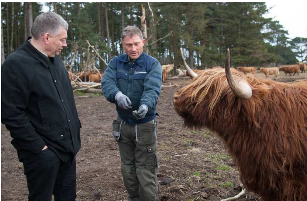
Statsrevisorerne på Strandegård Gods, hvor skotsk højlandskvæg græsser på Feddet.

Statsrevisorerne deltog i et kontrolbesøg på den økologiske landbrugsbedrift Strandegård Gods ved Faxe. Kontrollen af økologimærket omfattede foder, dyrehold, regnskaber mv. På Stendyssegård ved Rødvig på Stevns så Statsrevisorerne et miljøteknologi-projekt, hvor investering i luftrensning og gyllekøling giver ammoniakbesparelse og varme til opvarmning af staldene. Projekterne har fået støtte fra EU's landdistriktsprogram.