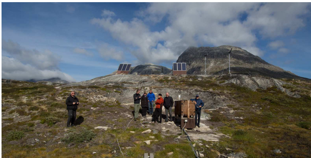
Ved Nuuk Basic's feltstation i Kobbefjord.

feltstation i Kobbefjord ca. 25 km fra Nuuk. Et hus på 55 m 2 var indrettet med laboratorium, lager mv. og har siden 2009 betjent forskere i forbindelse med programmet Nuuk Basic, hvis formål er at registrere klimaforandringeres påvirkning af økosystemer på land og til søs i det lavarktiske område. Der er tale om grundforskning og monitorering, og observationerne af klimapåvirkning på flora og fauna mv. stilles til rådighed for forskere og forskningsprojekter i hele verden.