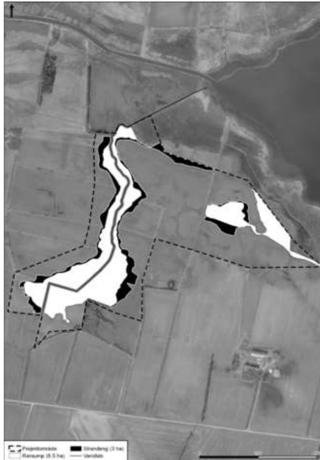
Oversigtsbillede over vådområdet