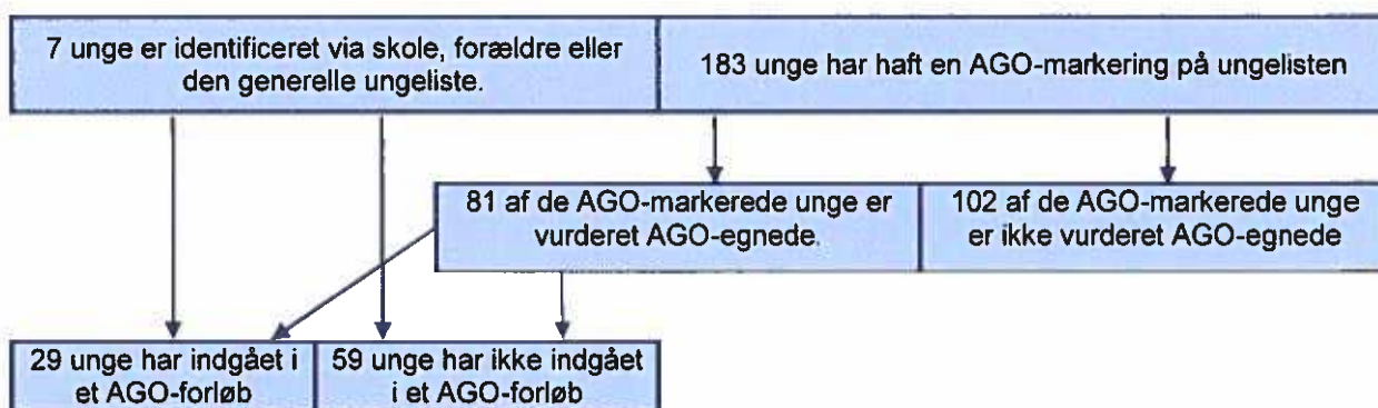
Figur 1. Opgørelse over AGO-forløb

Som figur 1 viser, er der 102 unge, der er vurderet til ikke at være AGO-egnede, selv om de har haft en AGO-markering på politiets ungeliste. Det drejer sig hovedsageligt om tilfælde, hvor den unges forseelse fremstår alt for bagatelagtig, eksempelvis hvis den unge har tisset op ad en husmur, kørt for stærkt på knallert eller forstyrret den offentlige orden, men efterfulgt politiets anvisninger. Derudover ekskluderes en del tilfælde, hvor den unge i forvejen er omfattet af sociale foranstaltninger. Hvis disse foranstaltninger vurderes at være tilstrækkelige til at afhjælpe den adfærd, der har været