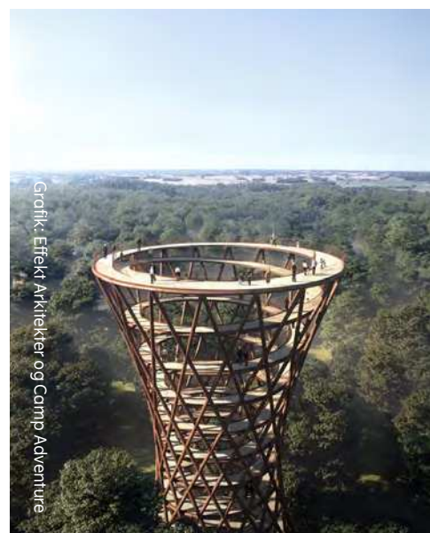
Grønik: Effekt Arkitekter og Camp Adventure