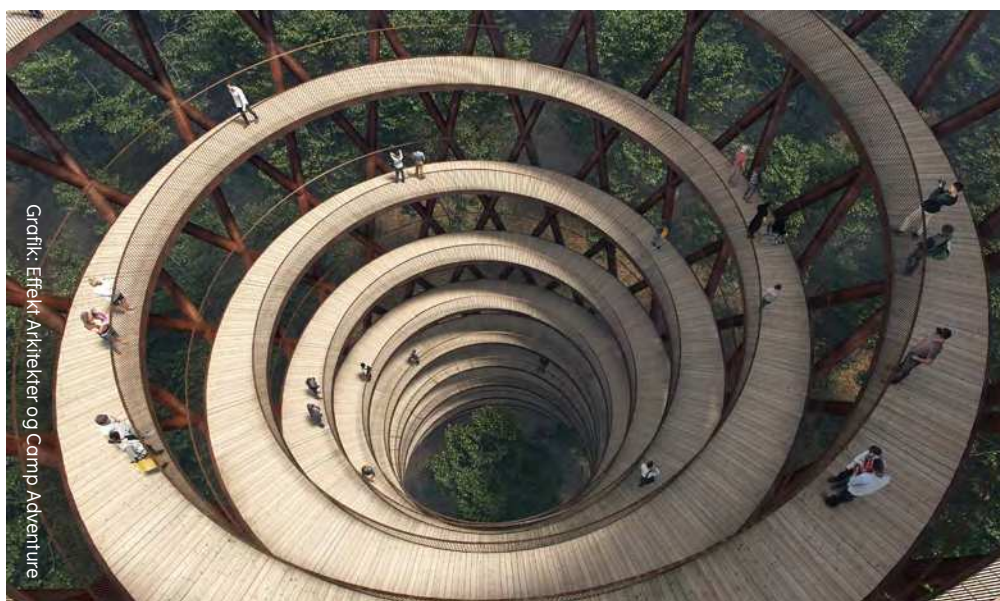
Grønik: Effekt Arkitekter og Camp Adventure

Projektet vil øge antallet af besøgende til området, og skabe nye arbejdspladser både på Camp Adventure og hos mange lokalt forankrede følgevirkninger.