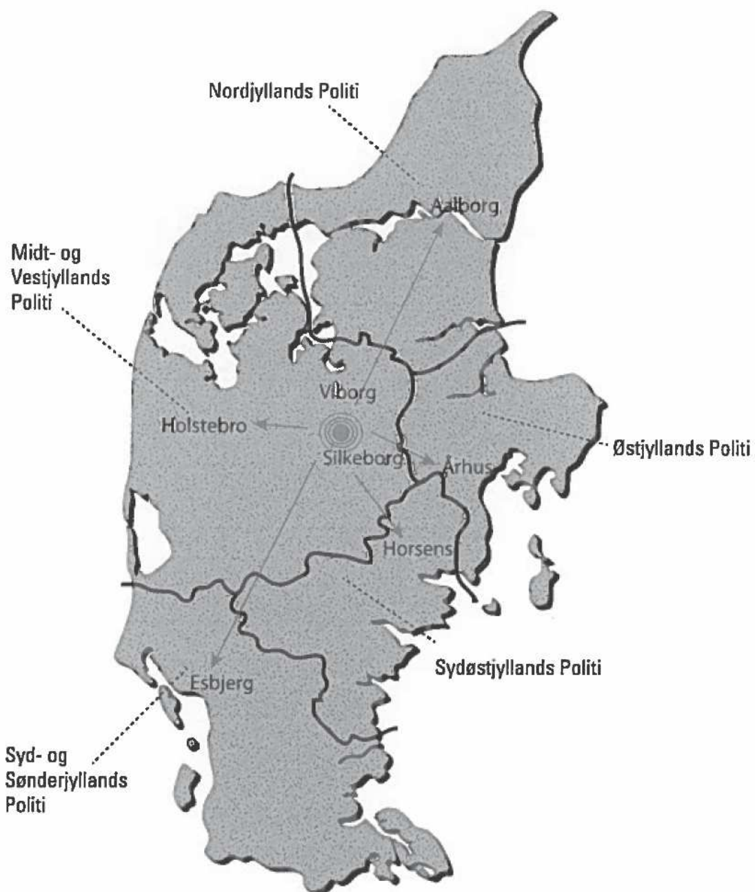
Placering ift. de jyske politikredse