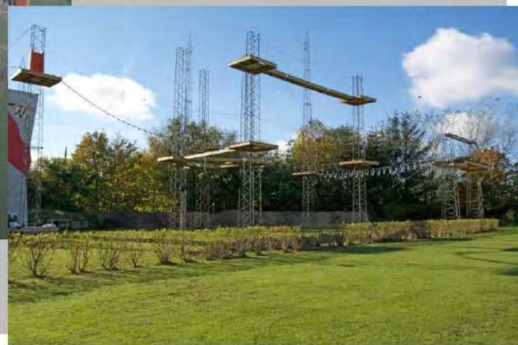
Træningsanlæg til rapelling, klatring m.v.